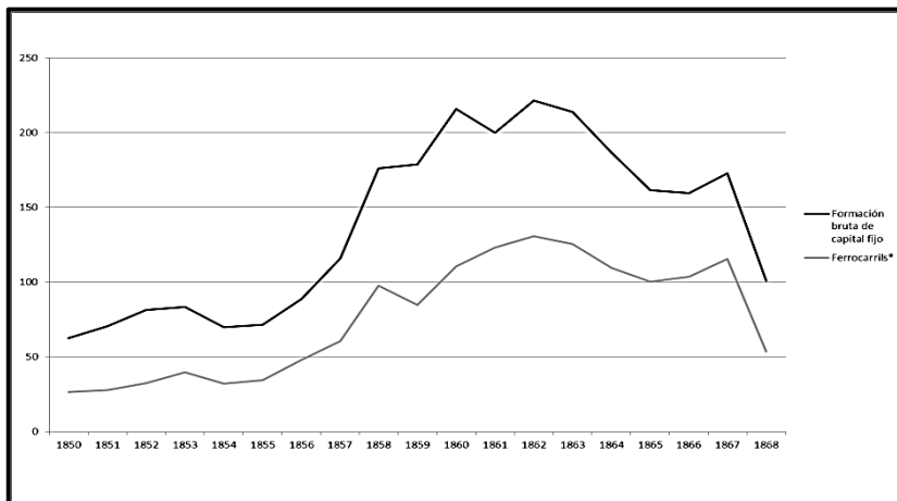
Figura 1 Formación bruta de capital fijo e inversión en ferrocarriles (millones de pesetas de 1995)

* Construcción no residencial más material de transporte.